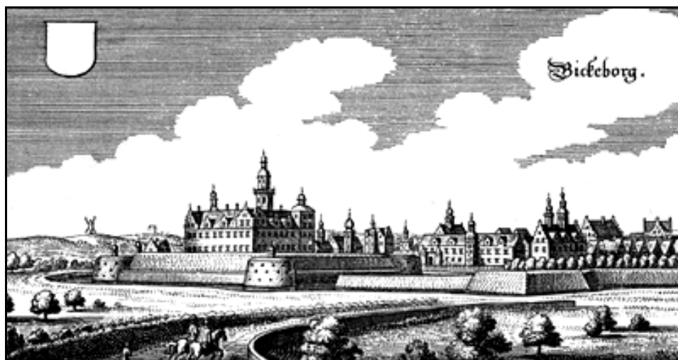
Schloss Bückeberg Mitte 17. Jh. (Merian).

Gründung der Bückeberg durch die Schaumburger Grafen dürfte kurz nach 1300. Erste Nennung 1304. Mitte des 14. Jhs. entwickelte sich im Anschluss an die Wasserburg ein Flecken mit Burgmannenhöfen, der erst im 16./17. Jh. seinen Aufschwung zur Residenzstadt nahm. Gräfliche Residenz. Zur Stadt: 1365 Weichbildrecht; Burgmanensitze; im 14. Jh. wohl schon Umwallung, um 1560 erneuert; 1609 Erhebung zur Stadt.