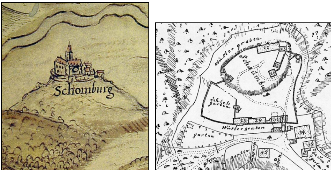
Schaumburg. Links Schaubild aus der Chorographia 1591. Rechts: Umzeichnung eines Planes von 1736.

Namengebende Burg der alten Grafschaft Schaumburg auf einer nach Süden vorgeschobenen Kuppe, dem Nesselberg. Ursprüngliche Burg auf dem oberen Burgplateau, ein gebrochenes Oval von knapp 100 auf 60 m, zur Weser hin errichtet worden. Unterhalb liegt nach Norden zum Wesergebirge hin die Vorburg, die vormals durch den „Wüsten Graben“ besonders geschützt war. Der Graben hat ursprünglich das gesamte obere Burgplateau umfasst. Im Osten führt ein Abschnitt des Grabens an der unteren Burg (Vorburg) entlang und mündet auf die von Osten kommende Zufahrt zur Schaumburg. Der Straßeneinschnitt gehörte zu dem Graben, der früher vor der Burg gegenüber der Gerichtslinde und der Gaststätte einst den Zugang zur Vorburg sperrte.