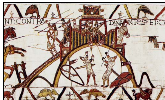
Osterburg bei Deckbergen. Links Vermessung der Universität Hannover. rechts. Burg von Typ Motte (Teppich von Bayeux, nach 1066).

Funde: hochmittelalterliche Scherben, darunter eine gelbtonige Scherbe Pingsdorfer Art mit Streifen- und Gittermuster, Fragmente eines Kästchenbeschlags aus Bein mit Verzierungen, Knochenstücke, Mörtelreste, Hüttenlehm sowie eine Flintklinge und einen Feuersteinabschlag. Datierung 12. Jh.