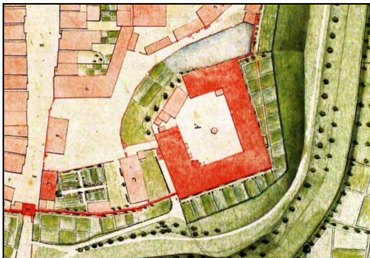
Schloss Stadthagen (Plan 18. Jh.).